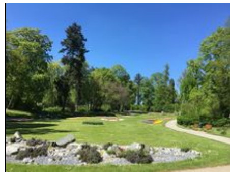
Stadtgarten - Stockach 75 m - Flair

AUSFLUGSZIELE im Umkreis von etwa einer halben Stunde sind: Singen - Tuttlingen - das nordwestliche Bodenseeufer von Sipplingen - Überlingen - Meersburg - sowie südwestlich die Blumeninsel Mainau - Konstanz - Radolfzell und Schaffhausen