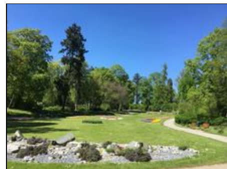
Stadtgarten - Stockach 75 m - Flair

AUSFLUGSZIELE im Umkreis von etwa einer halben Stunde sind: Singen - Tuttlingen - das nordwestliche Bodenseeufer von Sipplingen - Überlingen - Meersburg - sowie südwestlich die Blumeninsel Mainau - Konstanz - Radolfzell und Schaffhausen