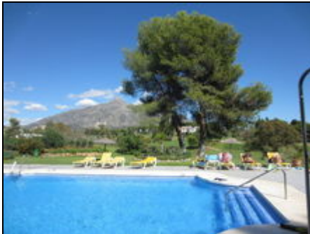
Wunderschöne Gartenanlage mit Schwimmbad

Komf. Ferienwohnung in einer ruhigen, exklusiven Wohnanlage, herrliche Poolanlage, zentral gelegen mit traumhaftem Panoramablick auf Berge und Meer.