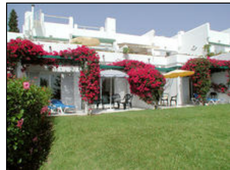
Terrasse mit Sitzgruppe und Gartenliegen

Ausführliche Informationen über Marbella und die Umgebung finden die auf unserer Homepage, zu finden am Ende dieser Seite unter "Kontakt"