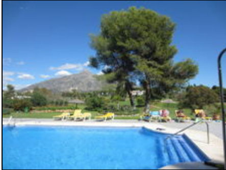
Wunderschöne Gartenanlage mit Schwimmbad

Komf. Ferienwohnung in einer ruhigen, exklusiven Wohnanlage, herrliche Poolanlage, zentral gelegen mit traumhaftem Panoramablick auf Berge und Meer.