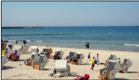
Strand vom Kolberg

Kolberg Resort bietet seinen Gästen eine saubere Luft, gute touristische Infrastruktur, Schlammbehandlungen und Heilsalzwasserquellen .