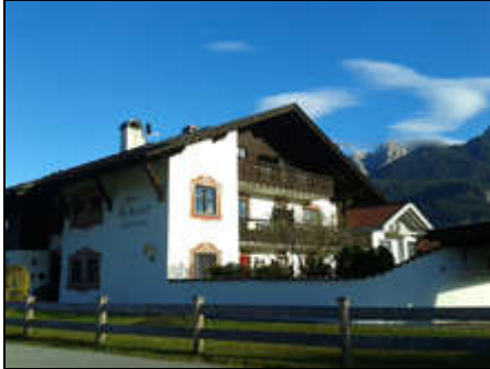
Am Kurpark 2

Komfortable, in 2015 renovierte und top-ausgestattete ****Ferienwohnung im gemütlichen Landhausstil mit umlaufendem Balkon und herrlichem Gebirgsblick