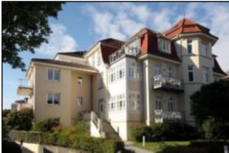
Dünenstr. 2, Hochparterre

Die Ferienwohnung ist individuell u. wohnlich ausgestattet, WLAN, Strandkorb am Strand, Tiefgaragenstellplatz. Gute Einkaufsmöglichkeiten.