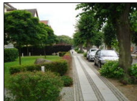
Dünenstr. 2, Eingang und Einfahrt

Zu ausgedehnten Radtouren und Wanderungen ist Kühlungsborn selbst (Stadtwald, Strandwege) sowie die Umgebung von Kühlungsborn bestens geeignet. Der Höhenzug "Kühlung" lädt ebenso dazu ein.