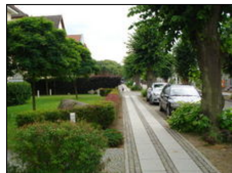
Dünenstr. 2, Eingang und Einfahrt

Zu ausgedehnten Radtouren und Wanderungen ist Kühlungsborn selbst (Stadtwald, Strandwege) sowie die Umgebung von Kühlungsborn bestens geeignet. Der Höhenzug "Kühlung" lädt ebenso dazu ein.