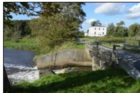
Wassermühle in Jyndeved/DK

Viele Ausflugsziele und Städte lassen sich innerhalb einer Autostunde von hier aus gut erreichen. Z.B. liegt die schöne Fördestadt Flensburg und das Wasserschloss Glücksburg nur eine halbe Std von hier entfernt. Die dänische Insel Røm (Rømø) ist mit ihrem riesen Strand (mit Auto befahrbar) in knapp einer Std. erreichbar. Ebenso lassen sich die Inseln Sylt, Föhr oder Helgoland von hier aus prima erreichen.