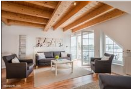
Wohn-/ Essbereich mit Schleiblick

Traumhafte Maisonette-Wohnung im 2. Stock auf der Werft mit Balkon und herrlicher Aussicht über die Süd- und Ostseite auf die Werft und die Schlei.