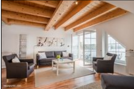
Wohn-/ Essbereich mit Schleiblick

Traumhafte Maisonette-Wohnung im 2. Stock auf der Werft mit Balkon und herrlicher Aussicht über die Süd- und Ostseite auf die Werft und die Schlei.