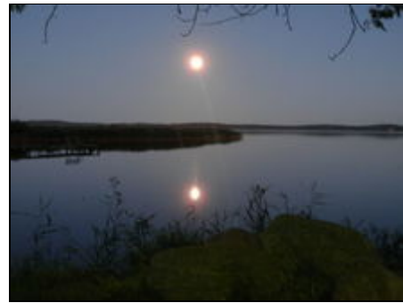
Sonnenuntergang am Achterwasser

Sanfte Hügel, Wäldchen, Wiesen und Ackerflächen prägen die Landschaft. Der Resthof liegt ruhig und zentral in einer Bodensenke die sich bis an die ca. 400 m entfernte Peene erstreckt. Es ist ein idealer Ausgangspunkt für Fahrradtouren an das angrenzende Achterwasser oder an die ca 4km entfernte Ostsee. Die historische Altstadt von Wolgast ist zu Fuß in ca.15 Minuten zu erreichen.Durch die direkte Bahnanbindung sind Ausflüge nach Greifswald, Stralsund oder Swinemünde stressfrei, Ohne Auto, sehr zu empfehlen.Sollte die Sonne einmal nicht zum Strand locken gibt es hier auf der Insel und in der näheren Umgebung viele interessante Sachen zu entdecken oder Sie genießen einfach die Ruhe im Garten.