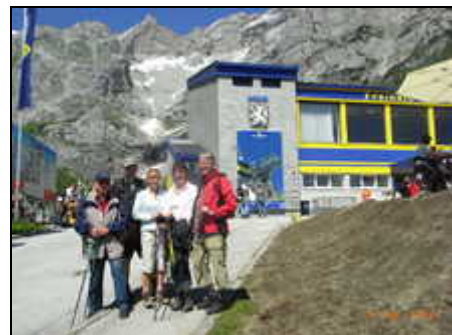
Auffahrt zum Dachstein

Im Sommer: Sommerrodeln auf der Hochwurzen.Direkt vom Haus weg Wandern, Tourengehen,Mountainbiken,Sommer und Winter Kutschenfahrten,urige Hütten,Bushaltestelle direkt vorm Haus.