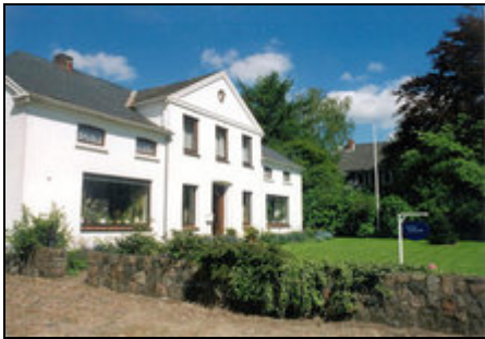
Vorderansicht Haus Jessen