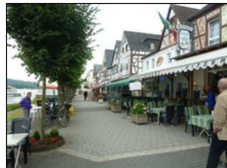
Rhein-Promenade Bad Breisig

Bad Breisig selbst hat eine der schönsten Promenaden am Mittelrhein und verfügt über eine hervorragende Gastronomie. Der gepflegte Kurpark, die Römer-Therme, gut ausgeschilderte Wander- u. Radwege