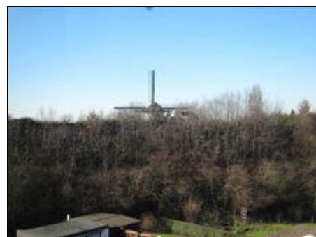
Blick auf die Baumeister Mühle

Mehrere Bäcker ein Metzger und ein Discounter, sowie Arzt und eine Apotheke sind in wenigen min. zu Fuß erreichbar.