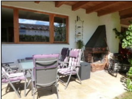
Terrasse mit offenem Kamin