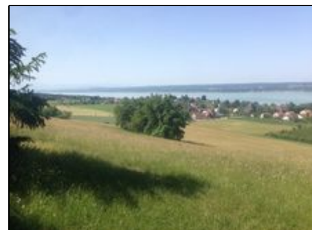
Breitbrunn am Ammersee

Karten und Freizeittipps liegen für Sie bereit.