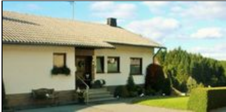
Ferienwohnung Waltraud Tibo

Neue und sehr gemütliche Ferienwohnung Nähe Nürburgring mit eigenem Eingang und Terrasse. Garage für Motorräder ,PKW Stellplätze direkt am Haus.