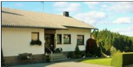
Ferienwohnung Waltraud Tibo

Neue und sehr gemütliche Ferienwohnung Nähe Nürburgring mit eigenem Eingang und Terrasse. Garage für Motorräder ,PKW Stellplätze direkt am Haus.