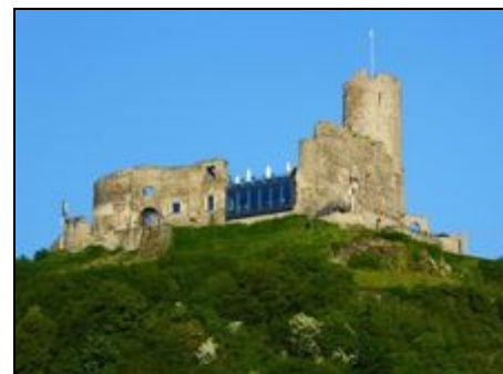
Herrlicher Balkonblick Burg Landskron

Unsere mittelalterliche Stadt lädt zum Verweilen ein. Die Umgebung bietet vielfältige Rad- und Wandermöglichkeiten, auch Tagesausflüge nach Trier, Koblenz, Cochem oder Luxemburg sind sehr beliebt. Die Kombination aus gutem Essen und den dazu passenden Weinen sollten Sie selbst erleben.