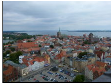
Aussicht Stralsund von der Marienkirche

Die historische Stralsunder Altstadt, lädt mit ihren historischen Häusern, den Kirchen, dem Meeresmuseum und dem Ozeaneum zu Besichtigungen ein. Durch seine zentrale Lage eignet sich Stralsund ideal als Ausgangspunkt für Touren/ Radtouren zu den Inseln Rügen, Hiddensee, Usedom und auf die Halbinsel Fischland-Darss-Zingst. Auch die Störtebeker Festspiele auf der Natürbühne in Ralswiek auf Rügen sind ein Besuch wert. In Stralsund findet jedes Jahr wieder die Traditionellen Mittwochsregatta statt.