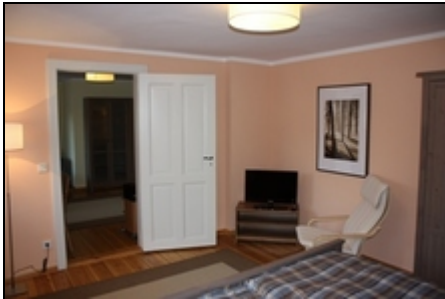
Blick in den Wohnbereich

Berlin erleben, direkt am Grunewaldsee, im Jagdschloß Grunewald. Gut ausgestattete, neue Ferienwohnung für maximal 3 Erw. oder 2 Erw. und 2 Kinder.