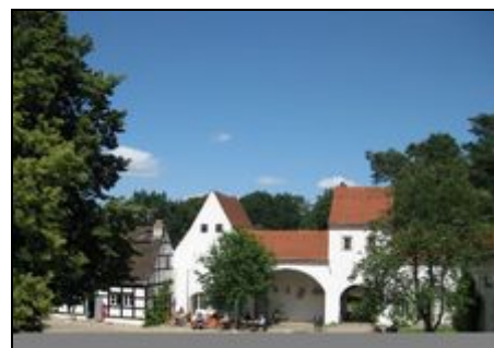
Schloßhof Jagdschloß Grunewald

Sie wohnen inmitten des Grunewaldes, am Grunewaldsee. Trotz der absolut einzigartigen Naturlage, sind Sie schnell in der City-West, am Messegelände oder in Potsdam. Da sich die Wohnung in einem Museum befindet, ist das etwaige Zustandekommen des Mietvertrages, stark an die jeweilige Hausordnung gebunden. Es gibt dort einen 24 Std. Wachschatz vor Ort.