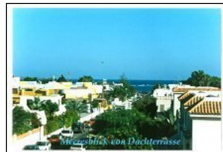
Blick von der Dachterrasse zum Strand

Das Haus liegt im ruhigen Wohnviertel. Nur 5 Min. zum Strand und Zentrum. Mehrere Supermärkte und Restaurants - Bars, sowie Tennisplätze, Tauch- und Surfschule in nächster Nähe. Direkte Ausflugs-Schiffsverbindung nach Lanzarote. Der eigentliche Fischerort hat seinen "flair" behalten. Die großen Sandstrände erreicht man mit Bus oder Taxi in 10 Min. Der kleine Sandstrand ist eine ruhige Badebucht. Wer Corralejo kennt: Das Apartment ist in der calle agua marina 2, hinter "fuente apartamentos"