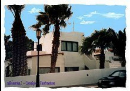
Casa Monterojo - Südansicht

Urlaub und Entspannung ganz privat- sehr gemütliche Ferienwohnung mit windgeschützter Dachterrasse. Deutsche Betreuung vor Ort.