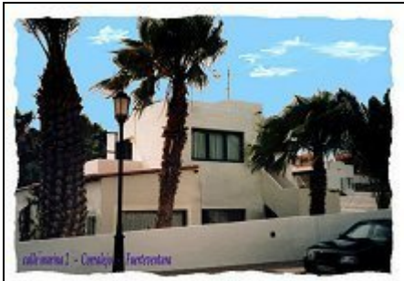
Casa Monterojo - Südansicht

Urlaub und Entspannung ganz privat- sehr gemütliche Ferienwohnung mit windgeschützter Dachterrasse. Deutsche Betreuung vor Ort.