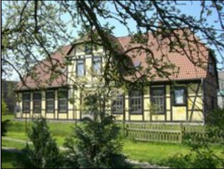
Die Frontseite des Alten Gutshauses

Ferienwohnungen im Alten Gutshaus inmitten einer idyllischen Seen- und Hügellandschaft nahe an der Ostsee mit Blick auf die Insel Usedom.