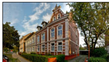
Die Hainholzstr. in der Kniepervorstadt

Sie erreichen die Sehenswürdigkeiten, Cafés oder Restaurants, wie auch die berühmten Kirchen und Museen gut zu Fuß. Ebenso gelangen sie in wenigen Gehminuten durch einen Park zur Sund-Promenade und zum Hafen. Als Stralsundbesucherinnen und -besucher sollten sie auf jeden Fall im Ozeaneum Wale und Pinguine bestaunen und im Hanse-Dom das Erlebnisbad oder die Wellnesslandschaft ausprobieren.