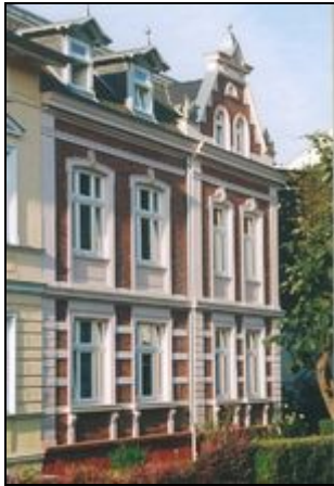
Stadtvilla aus dem Jahr 1897

Gemütliche Dachwohnung in bevorzugter Wohn-Lage, nahe zu Altstadt, Sundpromenade, Hafen und Altstadt sind fußläufig zu erreichen.