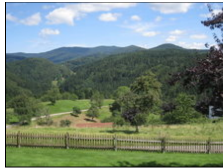
der Blick ins Wiesental

Der Ferienort Sallneck hat 380 Einwohner und liegt in der Region des "Kleinen Wiesentals" im äußersten Südwesten Deutschlands. Dieser Teil des Südschwarzwalds ist eine der schönsten Gegenden unseres Landes. Der Hochschwarzwald geht hier über in die liebliche Berglandschaft von Sallneck mit ihren aussichtsreichen Terrassen, die an klaren Tagen den Blick auf die Alpen und den Schweizer Jura bieten.