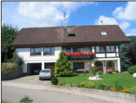
Ferienwohnung **** Gempp