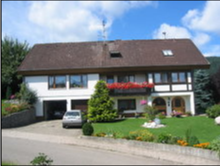
Ferienwohnung **** Gempp