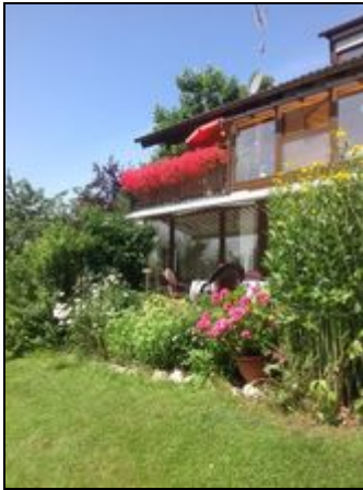
Fewo mit Terrasse und Wintergarten

Unsere familienfreundliche, ebenerdige Ferienwohnung befindet sich in ruhiger Lage mit herrlichem Blick auf die Chiemgauer und Berchtesgadener Alpen ..