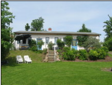
Haus von vorn

Landhaus Strietfeld an der Mecklenburgischen Seenplatte am Kressin See. Sanft und anregend ... Es ist ein Paradies zum anfassen und wohlfühlen.