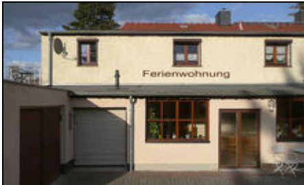
Gesamtansicht Haus - oben Ferienwohnung

Die Ferienwohnung in einer Doppelhaushälfte in einer Siedlung in Dresden-Kaditz an der Elbe gelegen. In der Nähe führt der Elberadweg entlang.