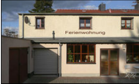
Gesamtansicht Haus - oben Ferienwohnung

Die Ferienwohnung in einer Doppelhaushälfte in einer Siedlung in Dresden-Kaditz an der Elbe gelegen. In der Nähe führt der Elberadweg entlang.