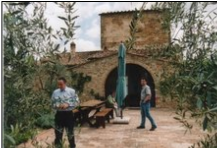
Ferienhaus AIA von der Terrasse aus

950 Jahre altes Steinhaus einer Bauernfestung im Dreieck San Gimignano - Siena - Florenz inmitten des Chianti-Classico-Weingebiets. Internet, Pool