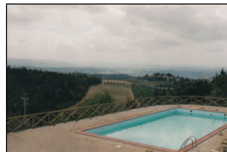
Pool unterhalb von CASA AIA

Sie befinden sich in kurzer Entfernung der klassischen Toskanastädte SAN GIMIGNANO (20 km), VOLTERRA (40 km), SIENA (30 km) FLORENZ (45 km) und Pisa (90 km). Wunderbares Wandergebiet durch die Naturschutzwälder vor der Tür und den einzigen wilden Zypressenwald Europas. Beste Flug- und Zugverbindungen (Florenz, Pisa) mit Autovermietungen. In den Weingütern unterhalb des Hauses sind Weinverkostungen möglich.