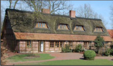
Haupthaus auf dem Huckelriederfeld - Hof

Unser Haupthaus: Ein schönes altes reetgedecktes Bauernhaus für bis zu 13 Personen.