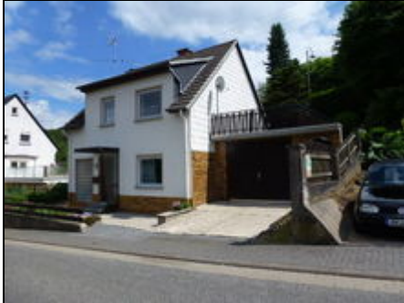
Ferienhaus mit Eingang

Ferienhaus (74 qm) für 4 Personen komfortabel eingerichtet. Sie finden dort eine Wohnküche, ein Wohnzimmer, 2 Schlafzimmer, 2 DU/WC, gr. Terrasse.