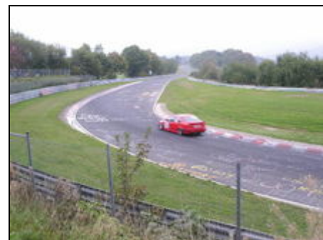
Nordschleife güne Hölle

Von uns aus erreichen Sie in kurzer Zeit Mosel, Rhein, das Ahrtal und die Städte Bonn, Köln und Koblenz. In unserer unmittelbaren Entfernung finden Sie Burgen, Schlösser und die Eifelmaare.