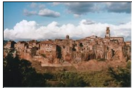
Blick auf Pitigliano

3 km nach Pitigliano mit seinen hochaufragenden Palast- und Burgenanlagen, Museen und Ghetto (Synagoge!). Neue Schwefelkuranlage!! 10 km zu den Felsenstädten mit Nekropolen SOVANA und SORANO; 20 km zum Lago di Bolsena; 40 km zum Meer (Nationalpark Ucellina, Monte Argentario mit Schiffsverkehr zu den Inseln Giglio und Giannutri); 20 km zu den Schwefelquellen SATURNIA; 30 km nach ORVIETO (Bahn nach Rom - 50Min. - und Florenz - 2 Std.); 20 km zum Bergmassiv Mt. Amiata (Wandern; Buddhistenzentrum Meriga