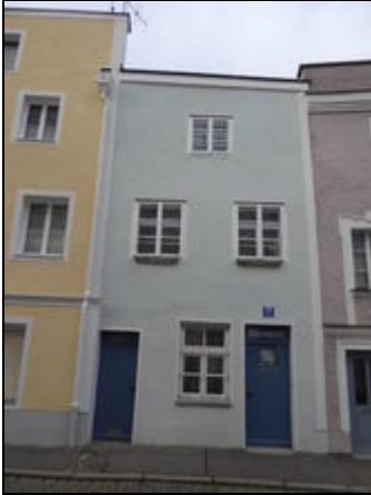
Straßenansicht Ferienhaus Löwengrube

Willkommen in der Löwengrube in Passau! Wir freuen uns, Ihnen unser schönes altes Stadthaus am Inn als Feriendomizil vorstellen zu können!