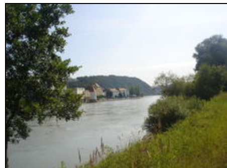
Blick auf den Inn zum Dreiflüsse-Eck

Für Kinder sind innerhalb von höchstens 15 Minuten Fußweg mehrere schöne Spielplätze vorhanden. Bei schlechtem Wetter bietet das Passauer Erlebnisbad ausreichend Tobe- und Entspannungsmöglichkeiten.