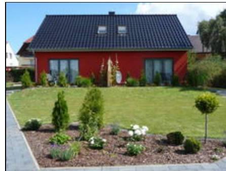
Ferienwohnung I ( rechte Seite )

Die Hansestadt Stralsund liegt im Zentrum zwischen der landschaftlich einmalig schönen Insel Rügen, der wild-romantischen Halbinsel Fischland/Darss und der Insel der Kaiserbäder Usedom. Stralsund selbst als Weltkulturerbestadt der UNESCO bietet eine Vielzahl von historischen Sehenswürdigkeiten, kirchliche und weltliche Bauten der Backsteingotik, das Flair einer See- und Handelsstadt und das in Deutschland einmalige Meeresmuseum mit dem Ozeaneum auf der Stralsunder Hafensinsel.