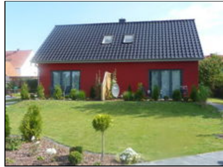
Ferienwohnung II ( links )