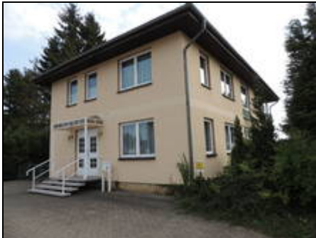
Freistehendes Feriengruppenhaus für 20 P

Das moderne Feriengruppenhaus in Stralsund bietet in seinen 8 hellen Schlafräumen und dem großen Wohnbereich ausreichend Platz für bis zu 20 Personen.