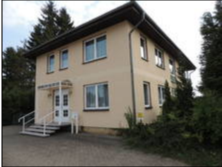
Freistehendes Feriengruppenhaus für 20 P

Das moderne Feriengruppenhaus in Stralsund bietet in seinen 8 hellen Schlafräumen und dem großen Wohnbereich ausreichend Platz für bis zu 20 Personen.