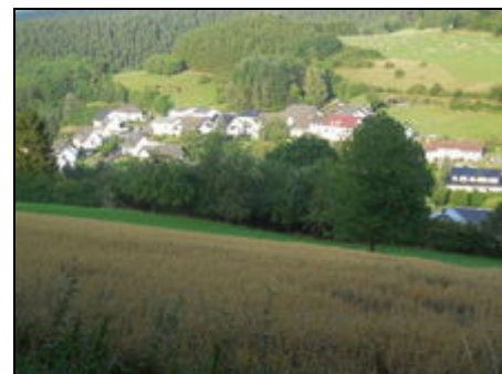
Gartenstraße mit Umgebung

Unser Ort erstreckt sich talaufwärts an den hügeligen Bergen der schönen Eifel entlang in einer Höhe von 350m-450m durch das Wimbachtal. Sie finden bei uns ein ausgebautes Wanderwegenetz, Nordic-Walking- und eine Mountainbikestrecke rund um den Nürburgring. Im 2km entfernten Adenau finden Sie Einkaufsmöglichkeiten, Reitmöglichkeiten und einen Tennisplatz. Die Eifelmaare und Radstrecken sind in unmittelbarer Umgebung. Ein Besuch lohnt sich in den Städten Köln, Bonn, Trier und Koblenz.