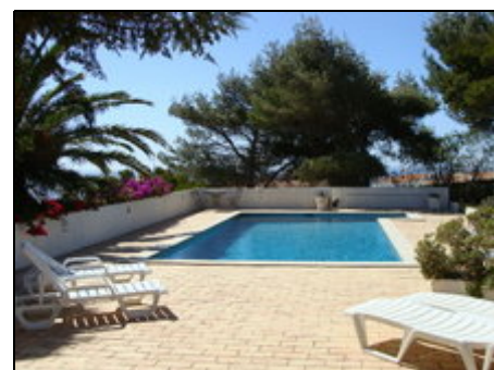
Pool und Garten

Abwechslung bieten Ausflüge ins betriebsame Lagos mit seinem reichen Kulturangebot oder zum Cabo Sao Vicente am südwestlichen Zipfel Portugals.