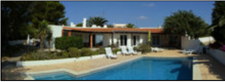
Dame de Salema

Die Villa liegt auf den Hügeln über dem Fischerdorf von Salema mit Blick auf das Meer und das Dorf. Zum Strand geht man nur 6 Minuten.