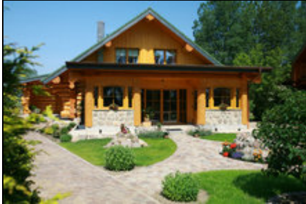
Wiesenspension Picha - Willkommen

2009 neu errichtete Pension im Baustiel eines kanadischen Trapperhauses. 6 separat vermietbare Doppelzimmer, jeweils mit eigenem Bad. Sauna vorhanden.