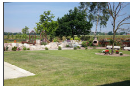
Ruheplatz mit Blickrichtung zum Meer

Die Wiesenspension liegt urlauberstrategisch optimal: 10km westlich von Rostock-Warnemünde. Heiligendamm ist nur 3 Kilometer entfernt. Kühlungsborn ist in 15 Min erreichbar. Ausflüge nach Bad-Doberan, Wismar, Graal-Müritz oder Stralsund sind alles Tagesausflüge. Am Strand von Börgerende-Rethwisch sind Sie in 5 Min. Unser Standort zeichnet sich durch gesundes und natürliches Umfeld aus, mecklenburgische Wildnis pur. Ruhe und immer frische Luft machen Lust auf Ausflüge in eine aufregende Umgebung.