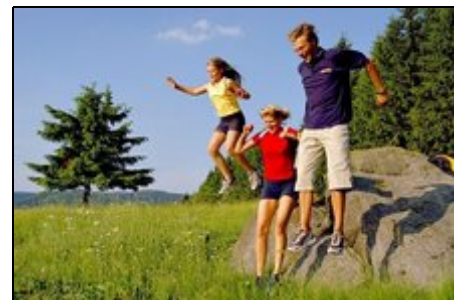
Umgebung von Oberschönau

Genießen Sie Ihren Urlaub in schöner Umgebung. Als schneesicheres Gebiet im Thüringer Wald hat sich Oberschönau längst profiliert. Gespurte Langlaufloipen und Abfahrtshänge direkt am Haus laden zum sportlichen Wintervergnügen ein. Unsere zentrale Lage ist Ausgangspunkt für Ausflüge in die nähere Umgebung, wie z. B. Weimar, Erfurt, Gotha, Eisenach u. a. Auch ein Waldschwimmbad mit Wasserrutsche liegt in unmittelbarer Nähe.