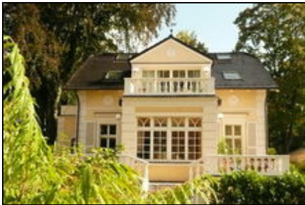
Ferienwohnung im EG

Ihr Traumurlaub in einer der schönsten Villen von Berlin-Wendenschloss.