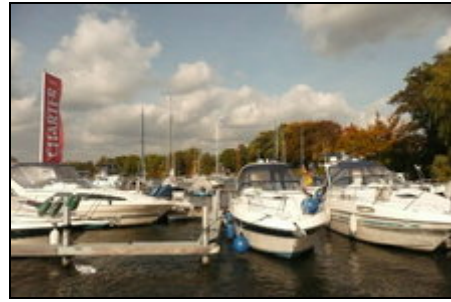
Blick auf unseren Hafen