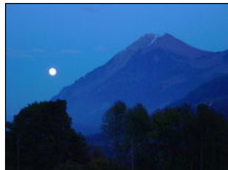
Niesen bei Vollmond

Idealer Ausgangspunkt für Wanderferien, Hochmoor, prähistorische Höhlen, Simmentaler Hausweg, Stockhorn und vieles mehr. Thuner- und Brienersee sind in 20, resp. 30 Auto/Min. erreichbar. Die BLS-Schiffahrt ist bemüht, ihren Gästen ein vielseitiges Angebot zu unterbreiten. Sport: Paragliding in Oberwil, Rafting in der Simme, Kajak in der Simme, Wildwasser Kajak, Kanu, Canyoning ab Boltigen, Fischen Stockensee, Simme, Forellensee Zweisimmen.