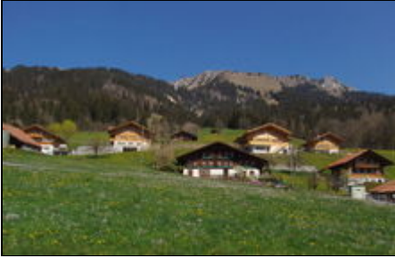
Der Hüpbach im Frühling

Der "Hüpbach" (renov. Bauernhaus Jg. 1664) befindet sich freistehend, an unverbauter, sonniger Hanglage im Dorfzentrum, 3-5 Fuss/Min. vom Bahnhof.