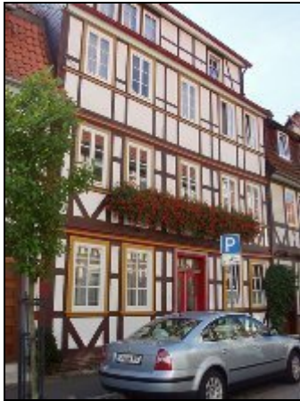
Haus von der Straßenseite

Restauriertes Fachwerkhaus am Südrand der hist. Altstadt von Duderstadt. 3 komplett eingerichtete, unterschiedlich große, gemütliche Ferienwohnungen .