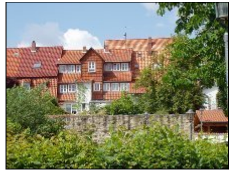
Blick über die historische Stadtmauer

Die Wohnungen liegen sehr günstig zum historischen Stadtzentrum mit Fußgängerzone.