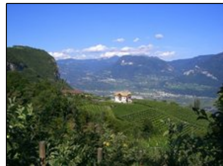
Lage d. Ferienhauses Santlhof/ Residence

Ausgangspunkt vom Haus für verschiedene leichte und anspruchsvolle Wanderungen sowie Klettersteige und Freeclimbing Touren (500m vom Haus) in unmittelbarer Nähe. Historischer Ortskern mit Museum (Zeitreise Mensch) Weinlehrpfad, verschiedene Kulturelle Veranstaltungen. Bademöglichkeiten in den umliegenden Seen (15min). Tagesausflüge zu den Dolomiten (50km) Gardasee (80km) Venedig (250km) Meran (45km) Bozen (30km) Verona (100km)