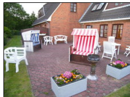
Terasse der Erdgeschosswohnung

Föhr hat neben seinen Stränden auch viele andere Sehenswürdigkeiten zu bieten. Durch die zentrale Lage Alkersums erreichen Sie schnell alle anderen Orte und Sehenswürdigkeiten der Insel in kürzester Zeit.