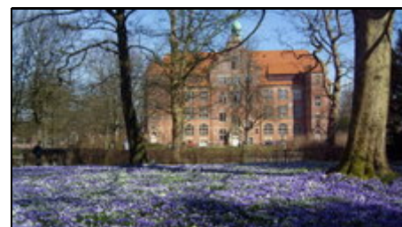
Krokusblüte auf dem Museumsberg

Das Marien-Quartier liegt in einer der ältesten Straßen der reizvollen Fördestadt. Mitten in der Altstadt finden Sie hier Ruhe u. nach ein paar Schritten pulsierendes Leben m. Cafés, Kneipen, einem breiten kulturellen Angebot (Theater, Kino, Musik etc.) und den historischen Kaufmannshöfen. Zum Ostseestrand sind es nur 1,5km. Die Schiffe bringen Sie zu Ausflugszielen rund um die Förde, auf deutscher und dänischer Seite! Vielfältige Freizeitangebote wie Angeln, Golf, Segeln, Radfahren u.v.m.