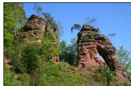
Schillerfelsen, in der Nähe des Hauses

Dahn ist ein guter Ausgangspunkt für das nahe Elsass und die Weinpfalz.