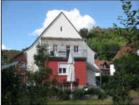
Außenansicht Haus am Schillerfelsen

Exklusive grundsanierte Ferienwohnung im Erdgeschoss mit Terrasse, Garten, Carport, WLAN und Blick zum Jungfernsprung, 79qm, mind. 5 Tage, 2 Personen