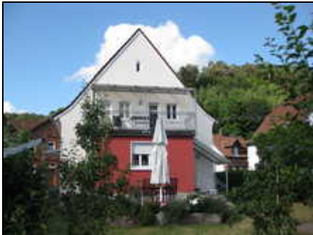
Außenansicht Haus am Schillerfelsen

Exklusive grundsanierte Ferienwohnung im Erdgeschoss mit Terrasse, Garten, Carport, WLAN und Blick zum Jungfernsprung, 79qm, mind. 5 Tage, 2 Personen