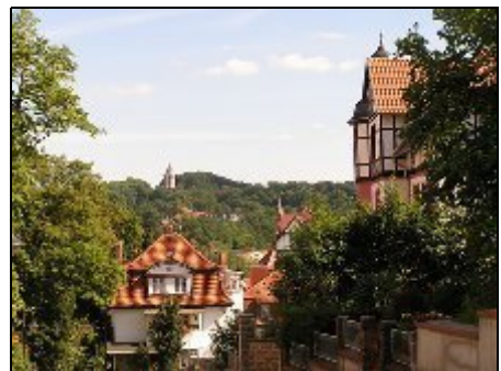
Blick vom Haus a. Burschenschaftsdenkmal