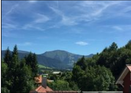
Traumhafter Ausblick vom Balkon

"Bergsuite Oberstaufen"; luxuriöse 3-Zimmer-Ferienwohnung in Premiurlage, mit grandiosem Hochgratblick; inkl. Oberstaufen-Plus-Karte.