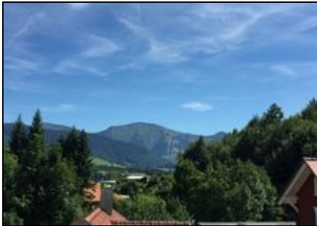
Traumhafter Ausblick vom Balkon

"Bergsuite Oberstaufen"; luxuriöse 3-Zimmer-Ferienwohnung in Premiurlage, mit grandiosem Hochgratblick; inkl. Oberstaufen-Plus-Karte.