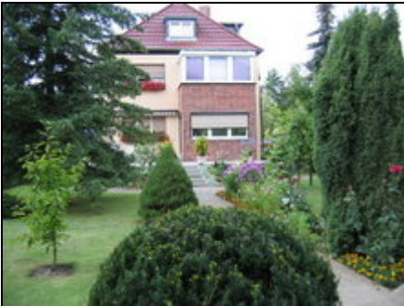
Wohnhaus mit Dachwohnung