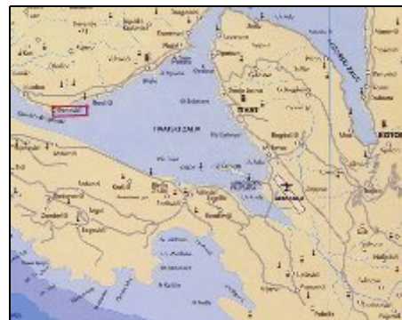
Bucht von Kotor

Weltbekannte Städte wie Dubrovnik, Mostar, Sveti Stefan, Budva der Skutari See, liegen alle im Umkreis von ca. 100 km.