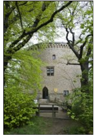
Zwinger Goslar Eingang Ferienwohnungen

Goslar/Harz 1000 jährige Kaiserstadt mit rd. 44.000 Einwohner. Die Goslarer-Altstadt und das Bergbaumuseum Rammelsberg gehören zum Weltkulturerbe der UNESCO. Die Stadt Goslar hat zahlreiche Sehenswürdigkeiten und bietet auch für den Naturliebhaber und für Sportler in unmittelbarer Nähe reichlich Angebote.